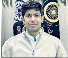
रेवाड़ी। डीसी अभिषेक मीणा।

हरियाणा सरकार ने महिलाओं को आत्मनिर्भर बनाने और उनकी आर्थिक व सामाजिक स्थिति में सुधार लाने के लिए हरियाणा मातृशक्ति उद्यमिता योजना शुरू की है, जिसके तहत बैंकों के माध्यम से 5 लाख रुपए तक का ऋण उपलब्ध कराया जा रहा है। डीसी अभिषेक मीणा ने बताया कि हरियाणा मातृशक्ति उद्यमिता योजना